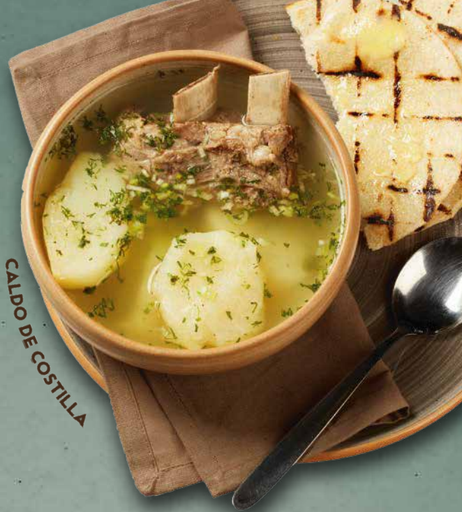
CALDO DE COSTILLA