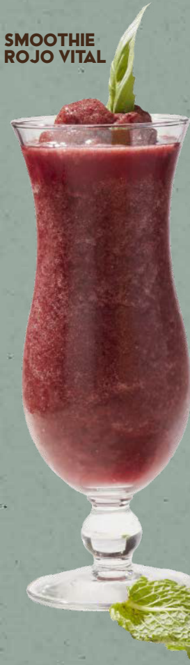
SMOOTHIE ROJO VITAL